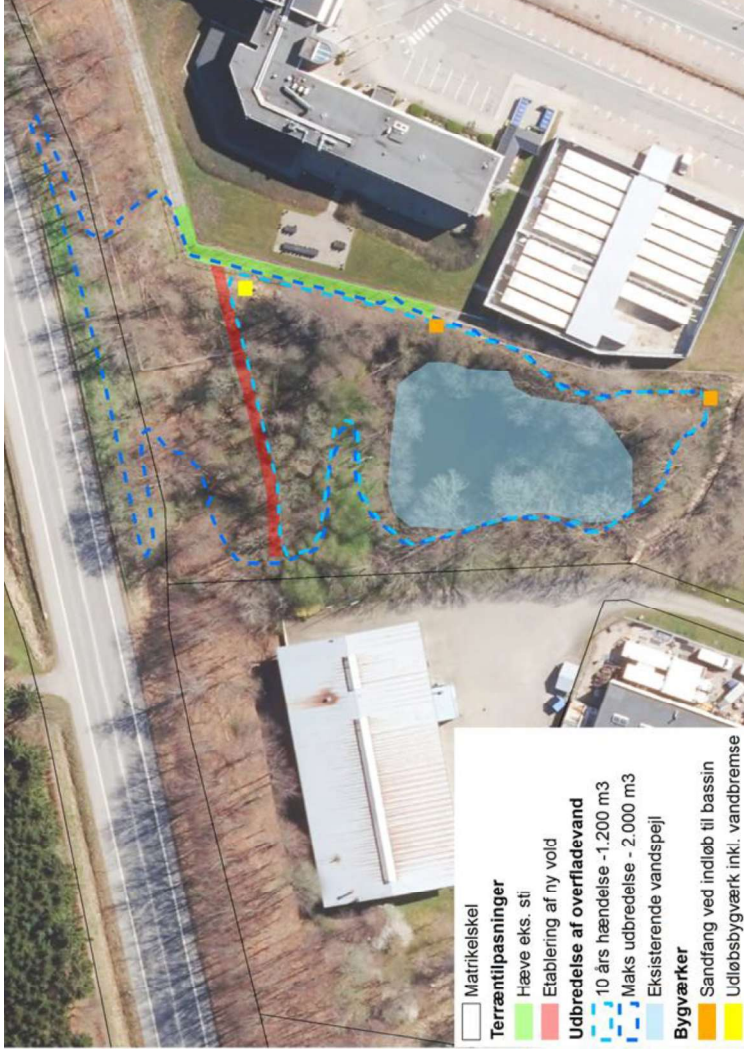
Figur 4 - Udbredelse af søen ved en 10-års og maksimal udbredelse (mere end en 50-års regnhændelse)